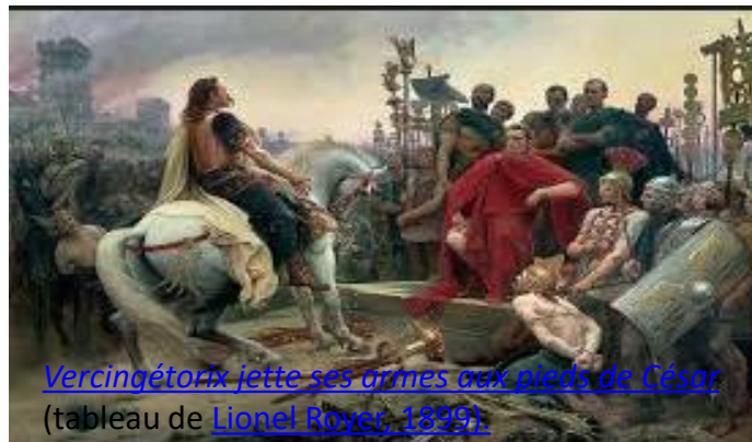
Vercingétorix jette ses armes aux pieds de César (tableau de Lionel Royer, 1899 )

Quelle grande bataille vous a permis de conquérir la Gaule ? C'est le siège d'Alésia