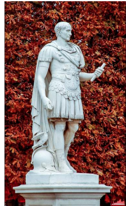
César (marbre d'après l'antique) ,jardin des Tuileries.

Mon père était Caius Julius Caesar III et ma mère : Aurelia Cotta. J'ai eu 4 enfants : Brutus, Julia, Ptolémée XV et j'ai adopté Auguste.