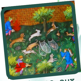
La chasse aux furets